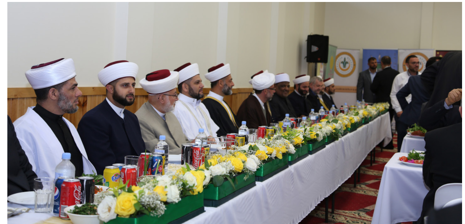
At the VIP Luncheon held by Darulfatwa Australia to welcome the Deputy Chairman of Al-Azhar.